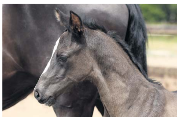
Governor en Etione Fortuna (v. Florencio) leverden bij Stoeterij Beltmanshoeve het laatste veulen.